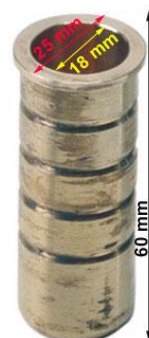
Messinghülse Best. Nr. 104