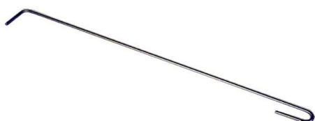
Glutkratzer Best. Nr. 150 A+B

Hersteller : Erwin und Rita Weber Tanneggerstrasse 28 8374 Dussnang Tel./Fax : 071 977 16 82 Internet : www.ringo-grill.ch