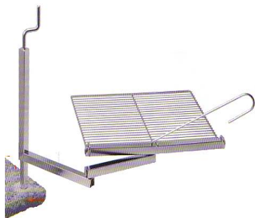
Schwenkarm (kompl.) Best. Nr. 101