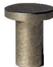
Abdeckkappe Best. Nr. 105