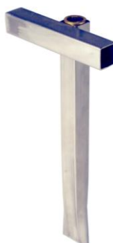
Bodensteckhalter Best. Nr. 108