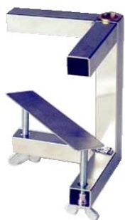
Klemmhalter Best. Nr. 106 A-C