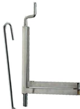
Schwenkarm Best. Nr. 102