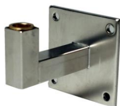
Wandhalterung Best. Nr. 110