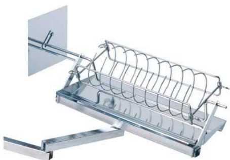
Bratenkorbset Best. Nr. 103 A + B