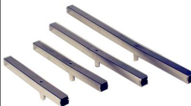
Rosthalter Best. Nr. RH 30 - 70