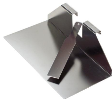
Racletteplatte Best. Nr. 109